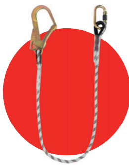
ELBERT 4082 Positioneringslijn XL 1.5 m Art. nr. 8.84.082.00