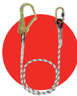
HAYES 4083 Positioneringslijn XL 2 m Art. nr. 8.84.083.00