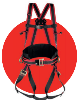
4012 HARNAS 5D Harnas 5D Art. nr. 8.84.012.00