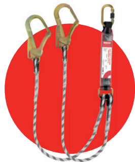
JURA 4062 Y-vanglijn XL met valdemper 1,5 m Art. nr. 8.84.062.00