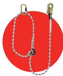
HELENA 4084 Positioneringslijn verstelbaar 2 m Art. nr. 8.84.084.00