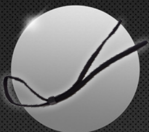
VISION 8900 BRILLENKOORDJE Art. nr. 7.78.900.00