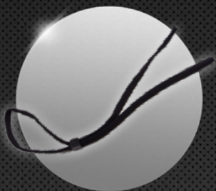
VISION 8900 BRILLENKOORDJE Art. nr. 7.78.900.00