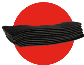
KIGALI 8205 Art. nr. 6.78.205.00