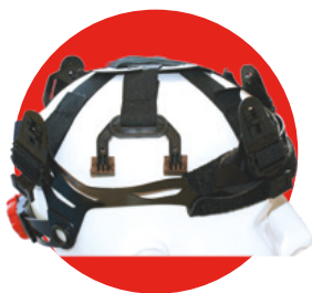
PRAIA 8215 Art. nr. 6.78.215.00