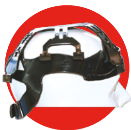
KINGSTON 8210 Art. nr. 6.78.210.00