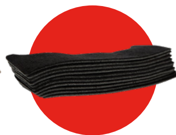
KIGALI 8205 Art. nr. 6.78.205.00