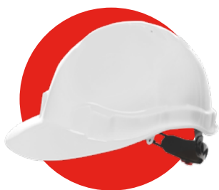
ASMARA 8050 Art. nr. 6.78.050.00