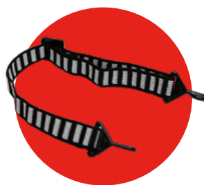
KAMPALA 8200 Art. nr. 6.78.200.00