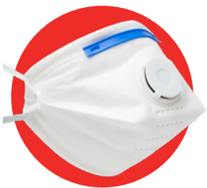
ANGA 4310 FFP3 NR D