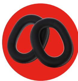
SONORA SPARE 8200