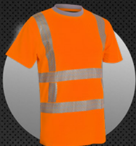
X-VIZ-FLEX 6200 RWS Art. nr. 2.76.201.00