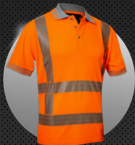
X-VIZ-COMFORT 6210 RWS Art. nr. 2.76.211.00