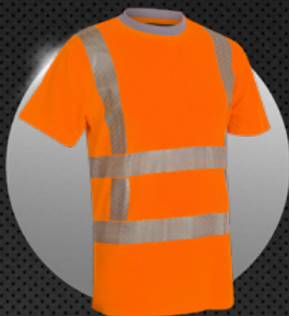
X-VIZ-FLEX 6200 RWS