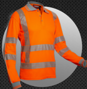
X-VIZ-COMFORT-LONG 6220 RWS