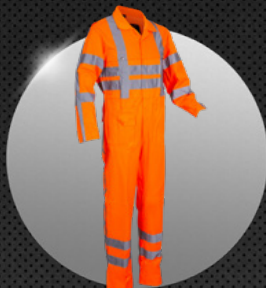
X-VIZ-ULTRA 5805 Art. nr. 2.45.807.00