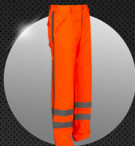
X-VIZ-STRONG 5825 Art. nr. 2.45.827.00

OXXA ELIDA 2358 KNIESTUKKEN Art. nr. 2.12.358.02