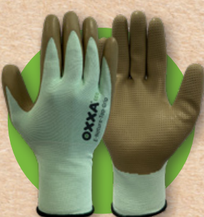
E-NATURE-TOP-GRIP 52-050 Art. nr. 1.52.050.00